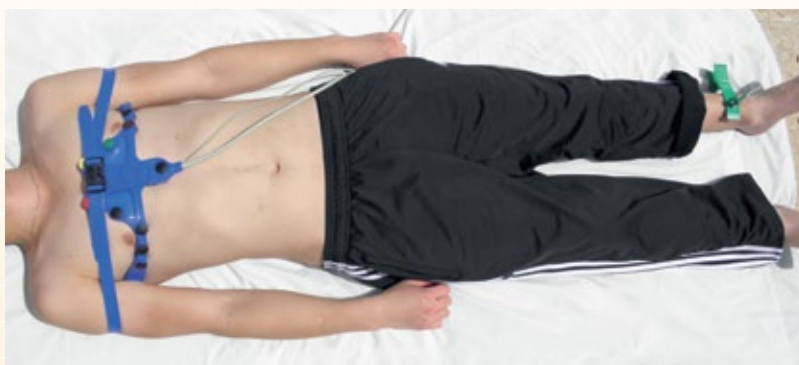
Рис. 2: Пояс Taruz на пациенте

Для хорошего качества ЭКГ важно, чтобы пациент во время исследования был спокоен, расслаблен, неподвижен и молчалив