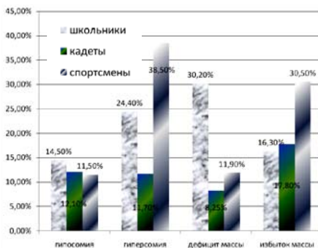
Рисунок 1. Характеристика физического развития подростков, подвергающихся различным видам нагрузки

Соматоскопия опорно-двигательного аппарата позволила выявить патологические изменения со стороны костно-мышечной системы. Так, сколиотическую осанку имеют в среднем 50% подростков всех групп, плоскостопие выявлено в 52-54% случаев, а деформации грудной клетки у 6-9% юношей. Прослеживается связь снижения костной прочности, особенно с развитием переломов, с наличием синдрома соединительнотканной дисплазии. В условиях повышенной физической нагрузки эти подростки нуждаются в дополнительном обследовании, особенно в оценке состояния сердечно-сосудистой системы.